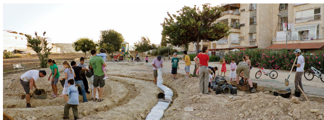
דימוי 9: מתוך הפרויקט 'מבוך בקטמונים'

המבוך היה אמור להיות מוקד משיכה בפארק העתידי ולסמן בשטח את תחילת הקמתו של הפארק. היסודות למבוך הונחו בעבודה קשה בשיטת 'שרוולי בוץ'.