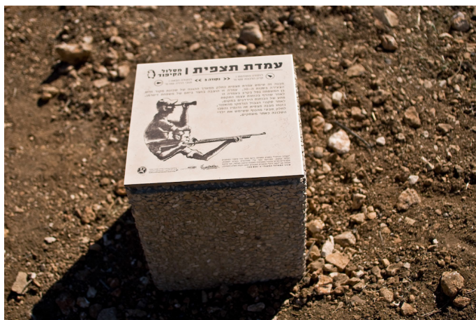
דימוי 6: תחנה מס' 3 במסלול הקיפוד (איור: רון דרור; קונספט: גיא אייזנר)

שלא כמו במסלולי הליכה מוכרים, המותווים בדרך כלל בתוך מרחב פנאי קיים, כאן יצר המסלול את המרחב, הקדים את הפארק וייצר הטרוטופיה, 14 אולי ההטרוטופיה המרכזית בתולדות המאבק להקמת הפארק (פוקו, 2010). לאירוע חנוכת המסלול בנובמבר 2008 הגיעו כ-150 תושבים. הם נפגשו ליד אריחי הקרמיקה, שמעו כמה מהסיפורים מפי התושבים וסיירו בשטחי הפרא, וכך חנכו את פארק המסילה כארבע שנים לפני חנוכתו הרשמית. כמו יצירתו המושגית של ריצ'ארד לונג 'קו שנוצר בהליכה' (1967), שנוצרה מצעידתו של לונג הלוחך ושוב על משטח עשב בשדות באנגליה עד שעקבותיו סימנו בו קו ישר, ההליכה המשותפת במסלול הקיפוד באירוע הייתה פעולה מטרימה שהתוותה מסלול להליכות עתידיות בפארק המסילה. במקרה של הפארק, ההליכה גם מימשה את זכותם של התושבים על השטח השייך להם. הצעידה באזור הנטוש הפכה לפעולה לניכוס מחדש של השטח הציבורי ושל ההיסטוריה המקומית בו בזמן (המסלול הוא גם אלטרנטיבה לפרויקטים עירוניים, כמו מסלול ה'תפוז' בתל אביב ו'תמונה באבן' בירושלים, המתעדים היסטוריוגרפיה הגמונית). אירוע חנוכת מסלול הקיפוד התקיים ב-21 בנובמבר 2008, כשבועיים לאחר בחירתו של ניר ברקת לראשות העיר בפעם הראשונה. יו"ר ועד התושבים למען פארק המסילה, פרופ' קימי קפלן, יוסי סעידוב ותושבים נוספים השכילו לפנות למועמדים עוד לפני יום הבחירות, ולאירוע השקת המסלול הגיעו, בין רבים אחרים,