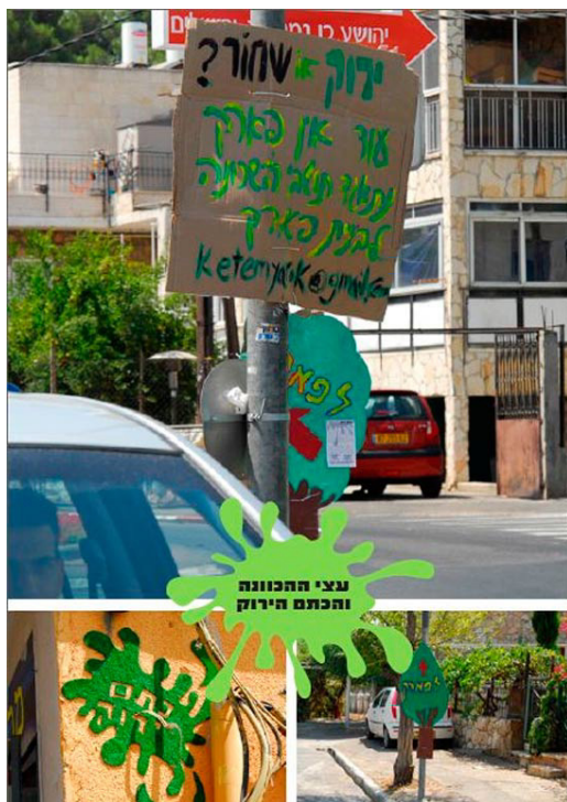
דימוי 4: פעילות של 'כתם ירוק' (עיצוב: נירו טאוב)

הצעדים הבאים של 'כתם ירוק' התרכזו בשני היבטים: (א) גיבוש הקהילה והגברת המודעות לתכנית הכביש ולהתארגנות למען שכונה ירוקה; (ב) עריכת אירועים בשכונה, ובעיקר הצבה של 'עובדות ירוקות' (גם אם סמליות) בשטח השכונה ובשטח הפארק המיועד. דוגמה ראשונה לכך הייתה תלייה של שלטי קרטון בצורת עצים שכיוונו את העוברים במקום אל הפארק, כלומר לשטח הנטוש בשכונה שבו רצו להקים את הפארק.