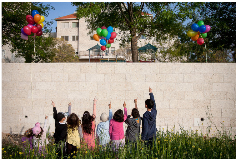
דימוי 10: מתוך הצילומים לסרט 'מעפים את החומה'

הרצון להפיל את החומה נראה כמקרה מבחן להפרדה בין שכונות, בין אוכלוסיות ובין שכבות חברתיות המאפיינות את ירושלים. זאת נראתה הזדמנות לעסוק בניסיון להפיל חומה אחת לפחות, או, כדברי הילדים, "להעיף אותה". החלום של יוסי ושל הילדים הפך לתרגיל לתלמידי הקורס בסמסטר החורף. אחד הסטודנטים העלה רעיון פשוט ומבריק: לצלם סרט בהשתתפות ילדי השכונה, המבוסס על הרעיון של סרט האנימציה Up , שבו קשיש מעתיק את ביתו למקום אחר באמצעות בלוני הליום, ולהקרין את הסרט על החומה עצמה באירוע בהשתתפות תושבי השכונה. אחד הגורמים המרכזיים להצלחת הפרויקט הזה היה נוכחותה של התקשורת באירוע והסיקור שהסרט, שהופץ ברשת, זכה לו בעקבותיה.